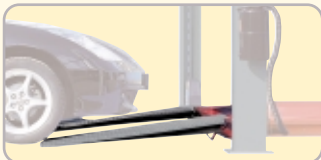
Rampe extralunghe / Long run up ramps Lange Auffahrampen