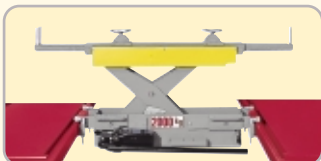
Traverse / Jacking beams / Achsheber