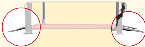
Rampe di discesa / Run off ramps Abfahrampen